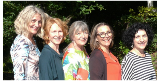
Das Team des Frauen-Jahres